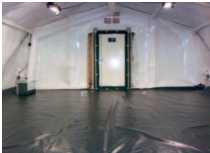
Innenansicht: Colpro 300 System, integriert in ein Schall-EHZ