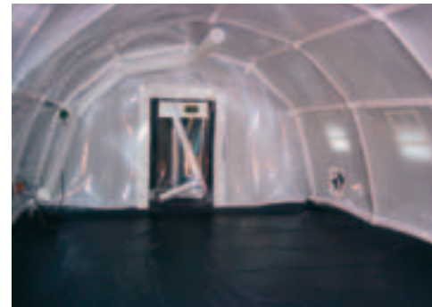
Innenansicht LGZ mit Colpro 300 System