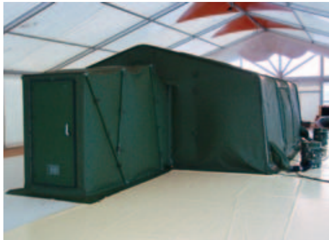
Schall-Einheitszelt EHZ mit Colpro 300 System. Außenansicht mit Patientenschleuse (STA)

Diese Colpro Systeme wurden von mehreren Armeen geprüft und sind im weltweiten Einsatz