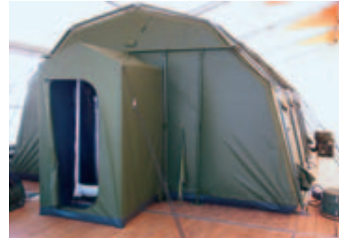
Außenansicht LGZ mit Personen-Airlock