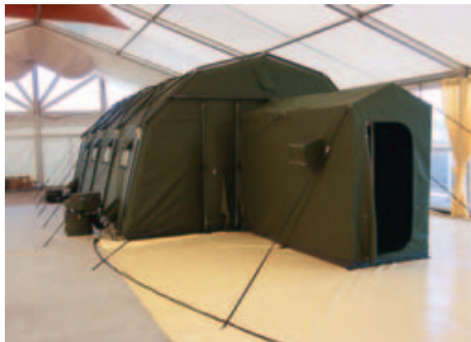
Schall-Luftgestütztes Zelt LGZ mit Colpro 300 System. Außenansicht mit Mehrstufen-Airlock (MSA)